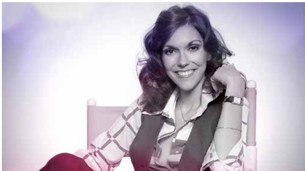
KAREN CARPENTER: HAMBRE DE PERFECCIÓN

Karen Carpenter fue la primera de una larga lista de celebridades que sufrieron trastornos alimentarios durante una época en la que el fenómeno, enormemente incomprendido, provocaba vergüenza y humillación pública. En esta película, por primera vez, se pone la lucha personal de Karen Carpenter en su propia voz a través de grabaciones nunca antes publicadas y de las voces legendarias de quienes la conocieron e inspiraron en su música.