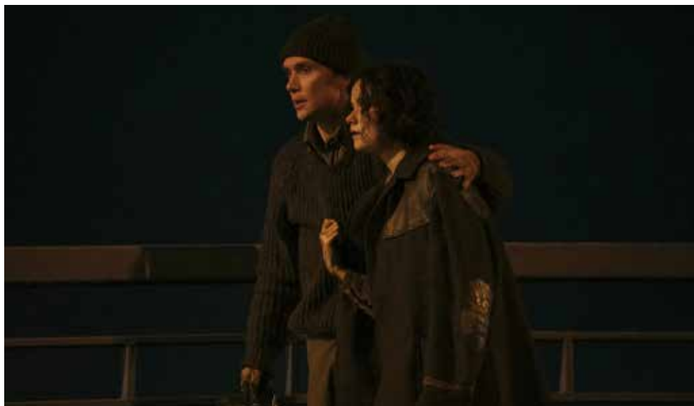
SMALL THINGS LIKE THESE

Para evitar que Mickey8, su clon de reemplazo, tome su lugar, Mickey 7, un robot llamado “prescindible”, es enviado a un planeta frío para colonizarlo. Adaptación del libro original de Edward Ashton.