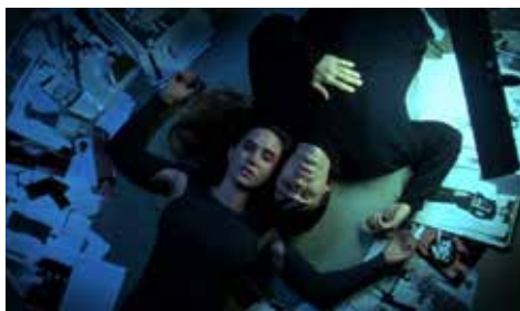
REQUIEM POR UN SUEÑO