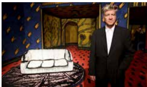
PRETTY AS A PICTURE: THE ART OF