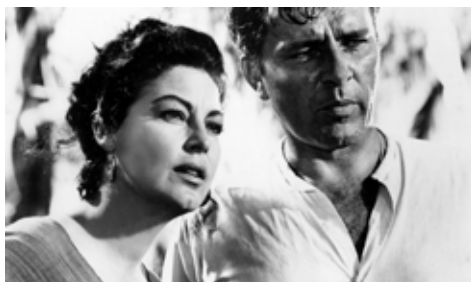
LA NOCHE DE LA IGUANA