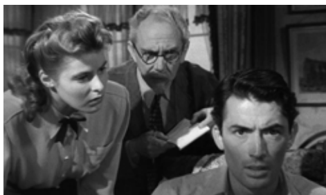
CUÉNTAME TU VIDA