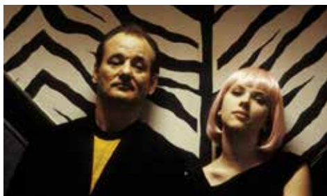
PERDIDOS EN TOKIO