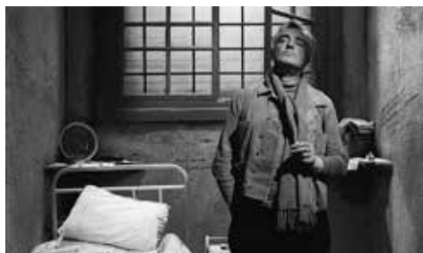
EL GENERAL DE LA ROVERE