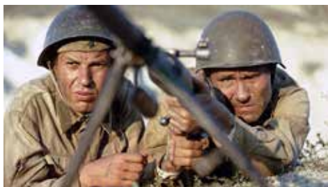
LUCHARON POR SU PATRIA