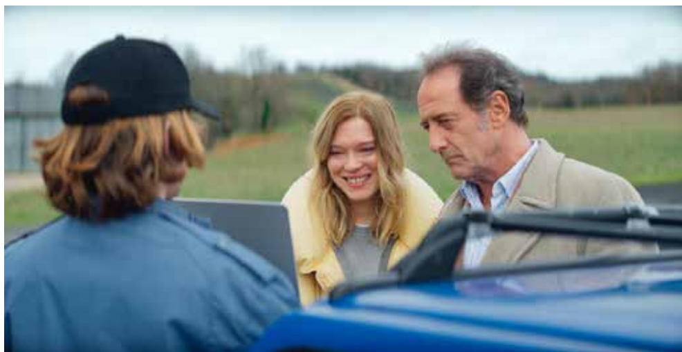
EL SEGUNDO ACTO

creativos de la cultura sobre la protección patrimonial y sus implicancias en la vida de todos es de vital importancia tanto para el presente como para el futuro. Porque finalmente el patrimonio es eso: un asunto que refiere al mañana, mucho más que al pasado.