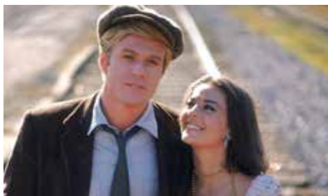
UNA MUJER SIN HORIZONTE