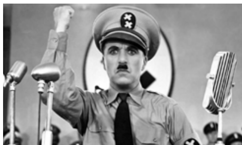
EL GRAN DICTADOR